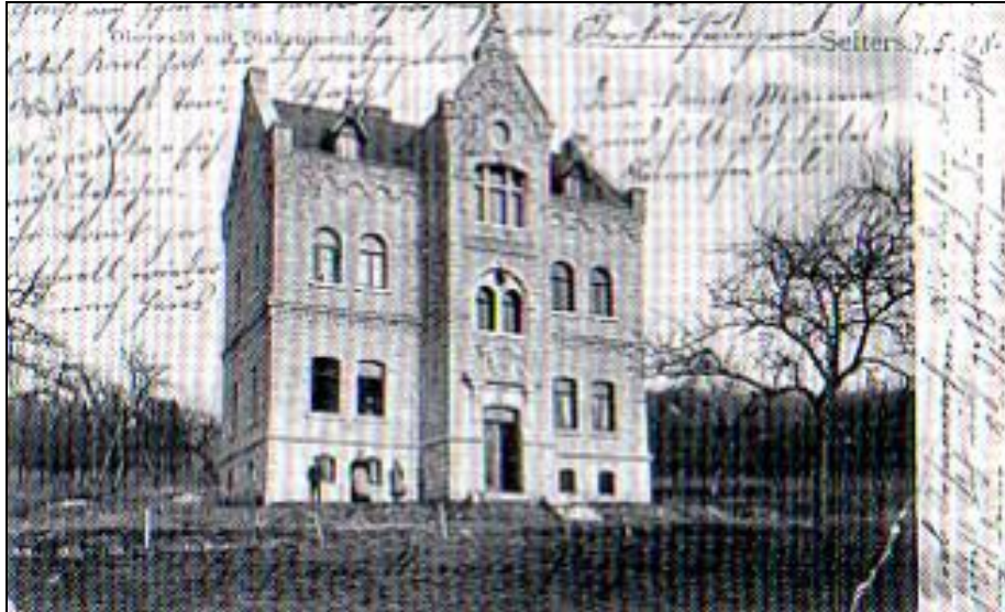
Der Erstbau des Selterser Krankenhauses im Jahre 1903